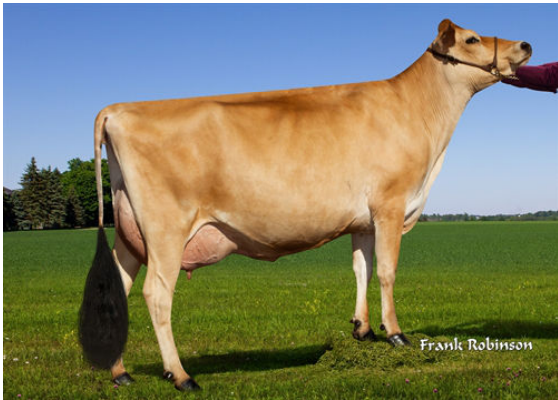
PROGENESIS MADISON- GRANDDAM